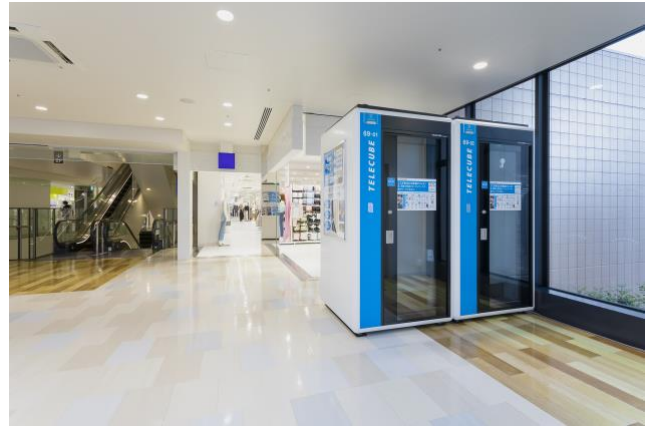
オフィスビル・商業施設内のテレキューブイメージ