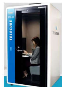
▲「テレキューブ Web 会議センター」（左から新丸の内ビル・豊洲フォレシア） ▲「テレキューブ」利用イメージ

5社は、今後も本センター並びに「テレキューブ」普及に向けた企画等を通じて、多様な働き方に対応する快適なテレワーク環境構築に資する様々な取り組みを進めてまいります。