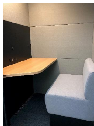
左) テレキューブ WEB 会議センター内テレキューブ実装タブレット・LED 照明