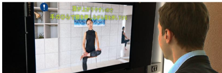
ZERO GYM：テレキューブ向け動画配信サービス